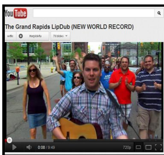
Figura 7. Captura del lipdub The Grand Rapids

Ciudadanía de Grand Rapids (Estado de Michigan, EEUU) cantando American Pie .