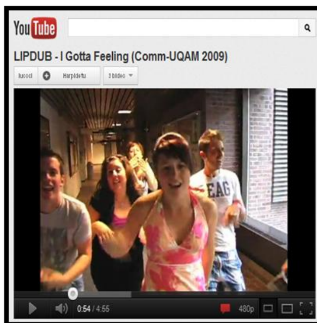
Figura 5. Captura de I Gotta Feeling

Estudiantes de Quebec durante la grabación del vídeo.