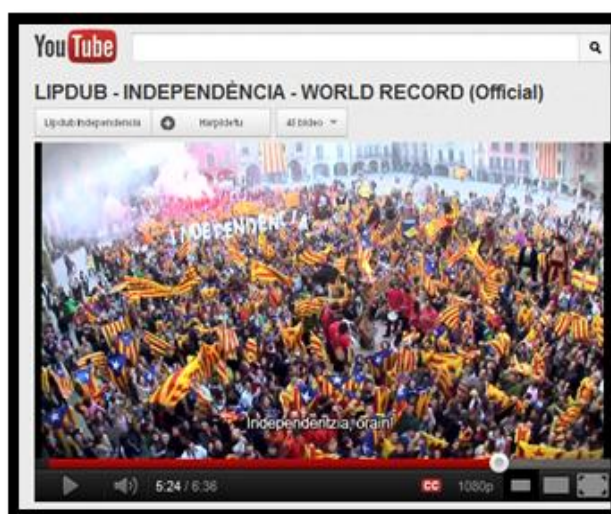
Figura 8. 1ª captura del Lipdub Independència

Expresiones de la identidad catalana son constantes a lo largo del vídeo.