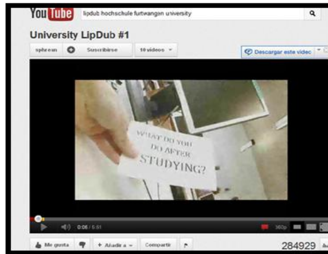
Imagen 2. El primer lipdub universitario en 2008

La Universidad de Hochschule Furtwangen (estado de Baden-Württemberg) hizo el primer lipdub universitario en 2008