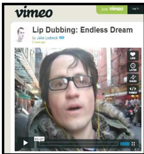
Imagen 1. Lip Dubbing: Endless Dream

El primer lipdub . Autor: Jakob Lodwick, fundador de Vimeo (2006).