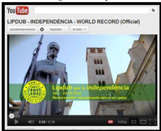
Imagen 3. El lipdub más numeroso en términos de participación

Este lipdub en favor de la independencia de Cataluña y los Países Catalans fue grabado el 24 de octubre de 2010 en la ciudad de Vic. La canción escogida fue La Flama , del grupo Obrint Pas .