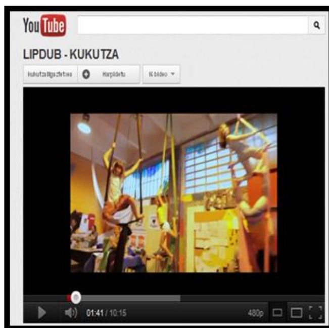
Figura 11.1ª captura del Lipdub Kukutza

El vídeo mostraba las diferentes actividades que tenían lugar en local Kukutza III (Bilbao)