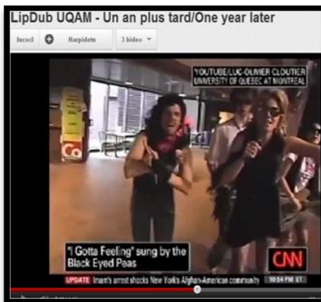
Figura 6. Cobertura mediática de I Gotta Feeling

La CNN informó del éxito de este lipdub .