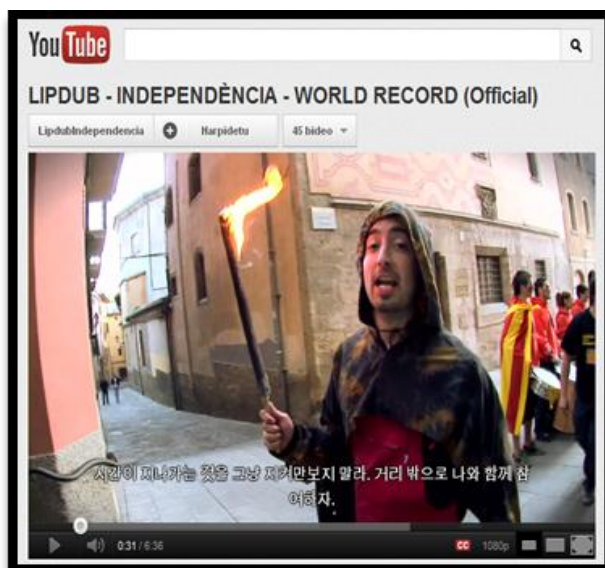
Figura 10. 3ª captura del Lipdub Independència

El vídeo tiene subtítulos en ocho lenguas incluido el coreano.