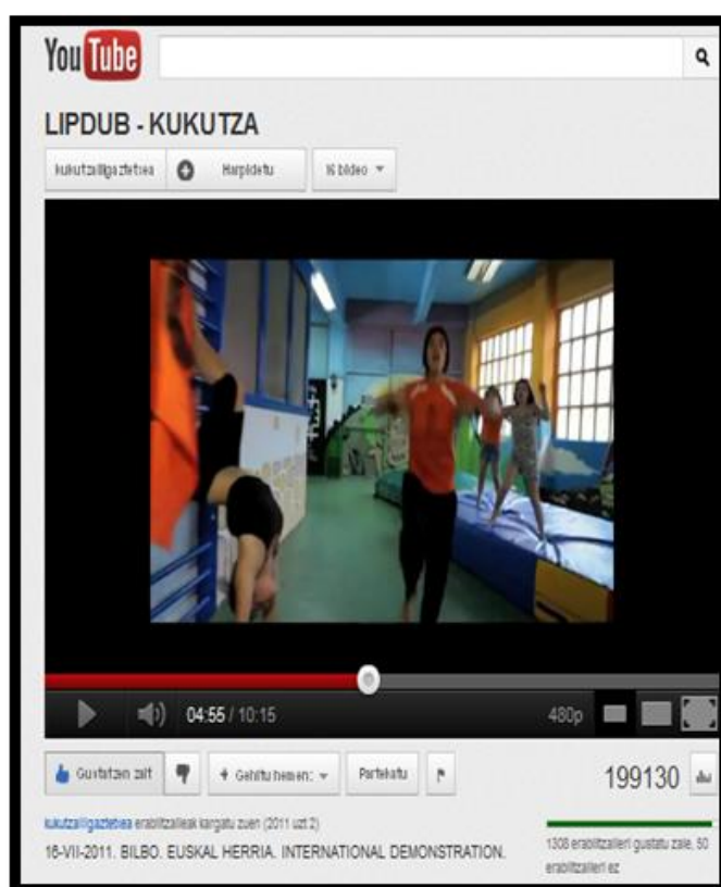
Figura 12. 2ª captura del Kikutza

En cualquier caso, se trató de un meritorio trabajo, un ejemplo de lo que es capaz de conseguir el trabajo colectivo y, sobre todo, un símbolo de la arbitrariedad con la que actúa el poder.