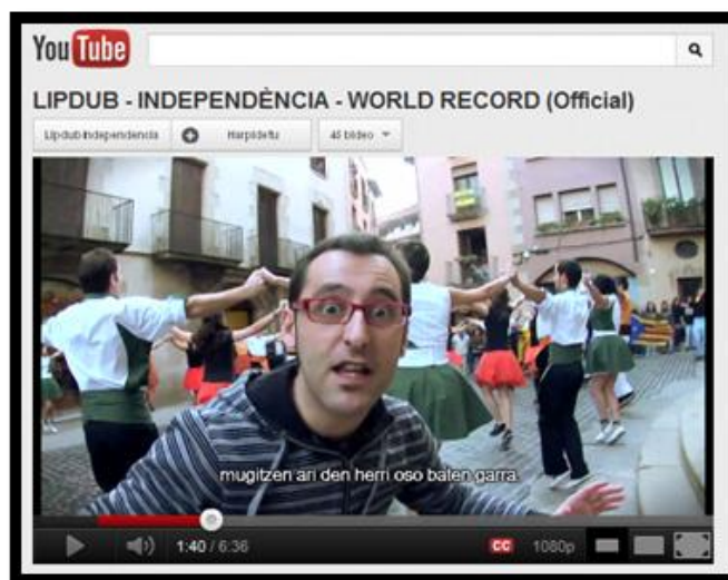
Figura 9. 2ª captura del lipdub Independència

La canción. La simbiosis entre el objetivo del lipdub y el mensaje de la canción resulta perfecta. El ritmo impuesto por la canción La flame añade vitalidad al vídeo y hace que todo fluya más fácil. Otro factor determinante es la adecuada duración: 06:36. El autor de la canción es el grupo valenciano Obrint Pas , conjunto que interpreta canciones en catalán que son una mezcla de rock, ska y reggae con toques de un instrumento tradicional, la dulzaina. El propio grupo colaboró en la producción del lipdub .