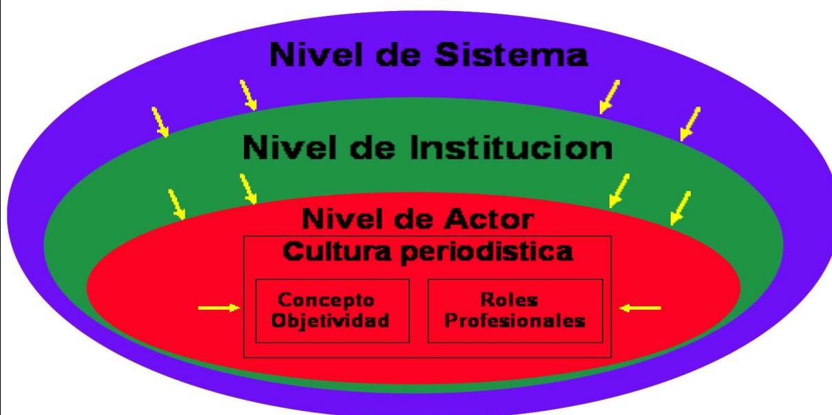
Gráfico 2: Representación gráfica de la estructura por niveles.

La influencia señalada por Esser (1998) de los/las periodistas sobre los niveles exteriores no es considerada en este modelo, ya que nos centraremos en el estudio del nivel interno: el nivel del actor. Nuestro modelo aparece representado, igual que el modelo de cebolla de Weischenberg, con tres círculos que representan cada uno los distintos niveles del contexto. En el centro situamos el nivel del actor, donde representamos la cultura periodística con las dos dimensiones de análisis en las que nos vamos a basar para nuestro estudio.