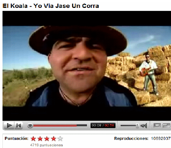
Figura 1. Ejemplo de reproductor de Youtube (captura realizada en enero de 2008)

En la Figura 1 mostramos una captura de la ventana de reproducción de Youtube tomada durante la recopilación de los datos.