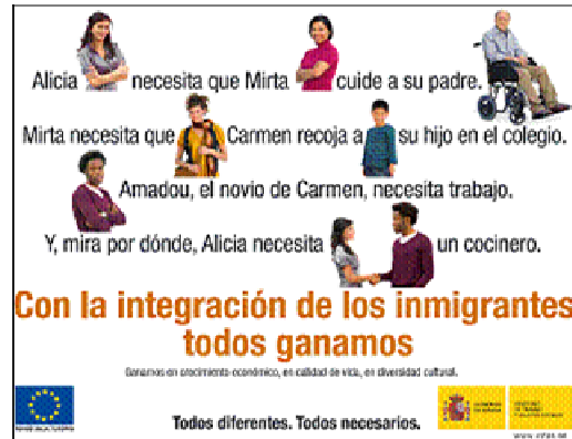
Cuadro 2. Valla de "Todos diferentes. Todos necesario", de 2007.

inmigrantes en España y cambiar la percepción de los nacionales hacia aquellos. La campaña va dirigida a jóvenes de entre 15 y 40 años y fue difundida en televisión, radio, prensa, Internet y en soportes de publicidad exterior [16]. Además la campaña obedece al artículo 3.1. a) y 3.3 de la Ley de publicidad y comunicación institucional. El artículo 3.1. a) propugna que sólo se podrán promover o contratar campañas institucionales de publicidad cuando tengan como objeto "promover la difusión y conocimiento de los valores y principios constitucionales". Y el artículo 3.3 dispone que "las campañas institucionales contribuirán a fomentar la igualdad entre hombres y mujeres y respetarán la diversidad social y cultural presente en la sociedad". En ambos artículos se alude a los derechos y deberes fundamentales reconocidos por la Constitución. A continuación se muestra el anuncio.