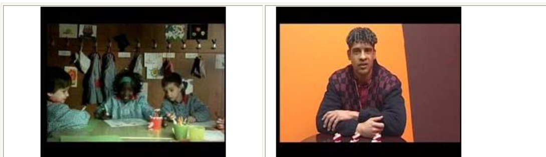
Cuadro 3. Spots de "Dóna corda al catalá", de 2005.

En este caso el aspecto más destacado por los inmigrantes fue la presencia en el spot de un personaje público (el entrenador del Fútbol Club Barcelona Franck Rijkaard) como líder de opinión. El empleo de personajes cercanos y pertenecientes a un elemento aglutinador cumple una doble función: presenta a un extranjero plenamente integrado en la sociedad española y a su vez es un elemento de cohesión social (el deporte concretado en el fútbol).