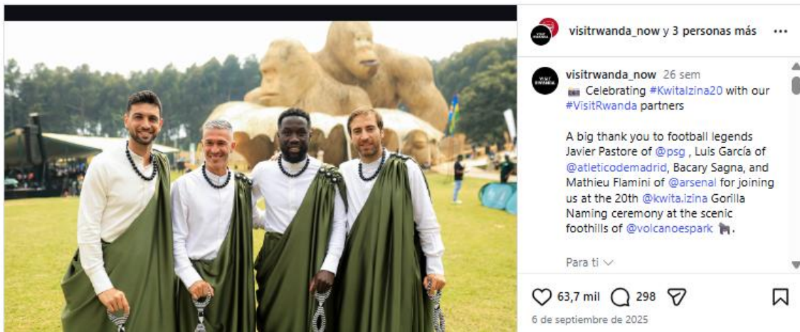
Figura 4. Segundo post con mayor nivel de engagement por parte del caso de Ruanda