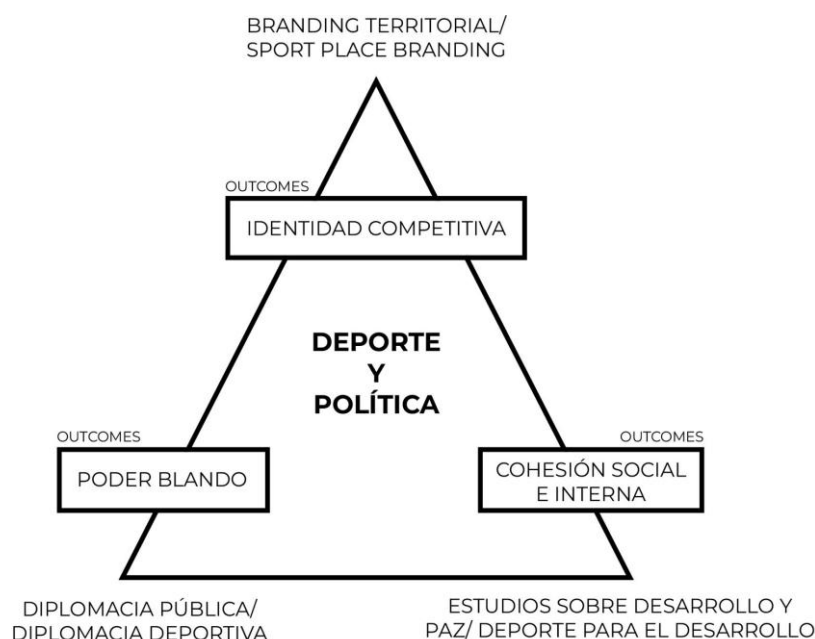
Figura 1. Diagrama conceptual del triángulo político del deporte