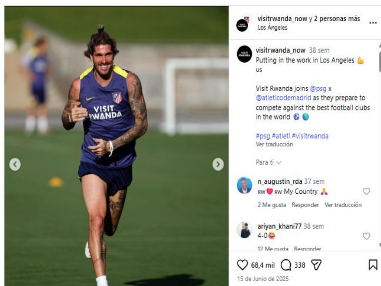
Figura 3. Post con mayor nivel de engagement por parte del caso de Ruanda