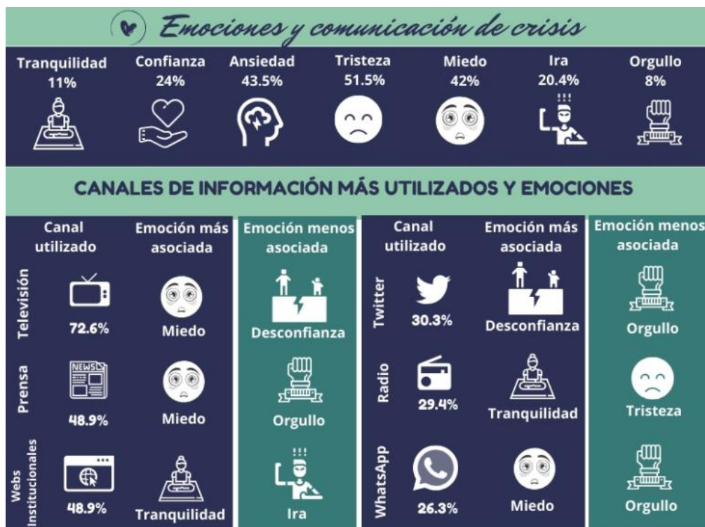
Imagen 2: Infografía resumen de las emociones compartidas por los encuestados durante la crisis.

El Orgullo , la emoción menos mencionada por los encuestados, es también el sentimiento menos asociado a la mitad de los canales (prensa, Twitter, WhatsApp y Facebook). Mientras que los consumidores de televisión sienten en menor grado Desconfianza , los oyentes de radio se desligan de la Tristeza y los usuarios de páginas web oficiales se alejan de la Ira . Resulta llamativo el caso de Instagram, cuyos usuarios tienen la Confianza como la emoción menos vinculada.