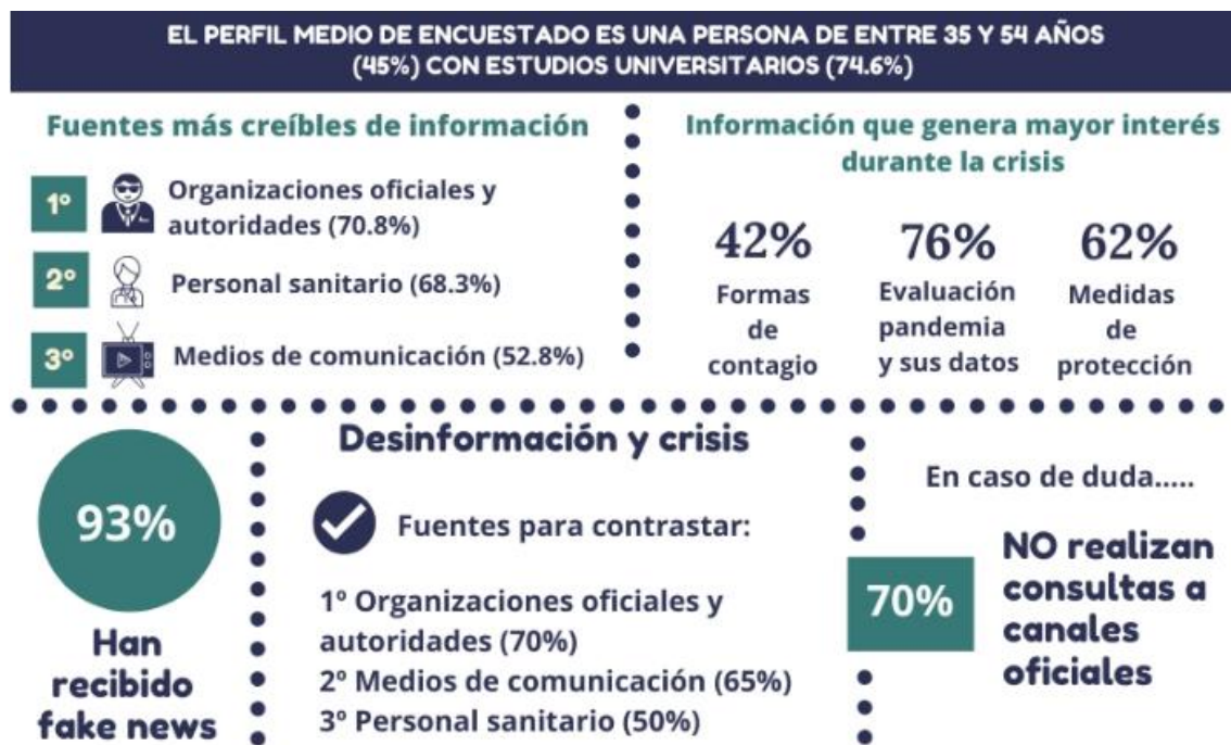
Imagen 1: Infografía resumen del perfil medio de encuestado y sus intereses informativos durante la pandemia.

reconocía no realizar consultas a canales oficiales, mientras que aquellos que sí que la realizan tienden a utilizar WhatsApp (13,28%), el teléfono (12,29%), las redes sociales (10,65%) y el correo electrónico (6,15%).