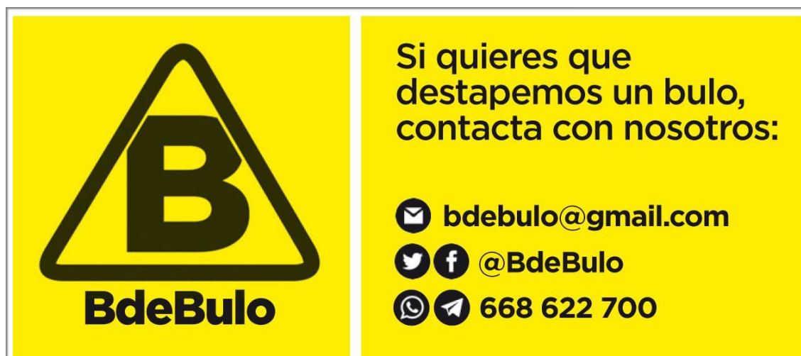
Imagen que acompaña a B de Bulo en redes sociales.

Muchos artículos de investigación han explorado la participación ciudadana en los cibermedios. Es más difícil encontrar estudios centrados en la visión interna profesional, describiendo y/o analizando