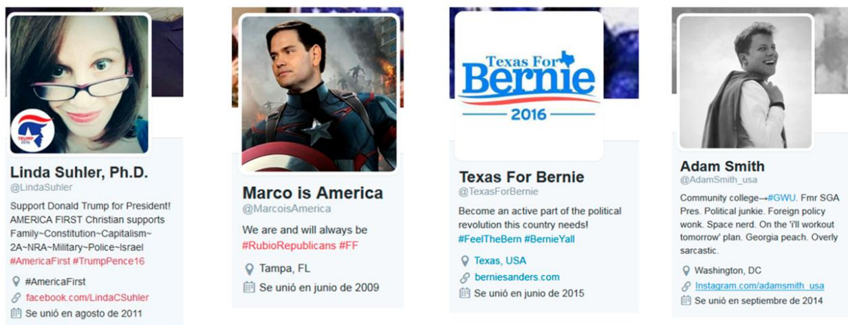
Gráfico 1. Perfiles de Twitter. Imágenes de los perfiles de las cuentas de Twitter que publicaron el mayor número de tuit con respecto a los candidatos: @ LindaSuhler (pro Donald Trump), @MarcoisAmerica (pro Marcos Rubio), @TexasForBernie (pro Bernie Sanders), @AdamSmith_usa (pro Hillary Clinton).

Era predecible que las cuentas de Twitter sobre política fueran las que más tuits generaran sobre los candidatos (véase gráfico 1), como fue el caso de Donald Trump, Marcos Rubio y Bernie Sanders. Sin embargo, interesante destacar que en el caso de Hillary Clinton fueron cuentas ajenas a la de los partidos políticos las que más tuits publicaron; fueron relevantes desde el punto de vista los datos cuantitativos porque se obtuvieron en el proceso de recuperación de tuits siguiendo los criterios estadísticos utilizados para extraer la muestra. Es un dato a considerar el interés por identificar los “influenciadores” ( influencers ) en las redes sociales; es una tarea clave en la comunicación política desarrollada en internet.