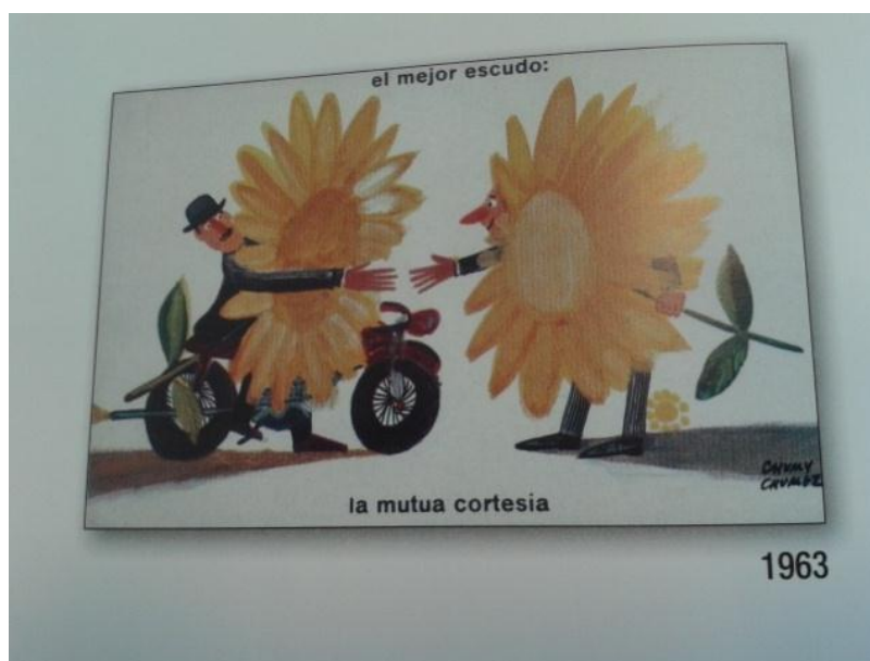
Imagen 1. El mejor escudo, la mutua cortesía. Código 0009. Año 1963.

tanto desde la crítica como desde la proyección de emociones positivas y negativas. Así, el caso de las campañas destinadas a modificar la conducta agresiva de los conductores, con la intención de reducir las discusiones de tráfico y sus consecuencias, representan una serie de anuncios donde el humor trata de provocar una sonrisa tras la decodificación del mensaje a la vez que critica la conducta del conductor y proyecta emociones negativas, como el miedo, la ira o la mezcla entre ira y alegría, pero también positivas como la alegría, la felicidad o la sorpresa. Son varios los anuncios que hemos detectado en este sentido, donde la ironía, los juegos de palabras y el discurso satírico son las modalidades utilizadas para sorprender al público y provocar la concienciación acerca de las consecuencias de los malos hábitos de los conductores: no utilizar el cinturón, conducir bajo los efectos del alcohol, no utilizar el casco en la moto o conducir con agresividad puede provocar la muerte.