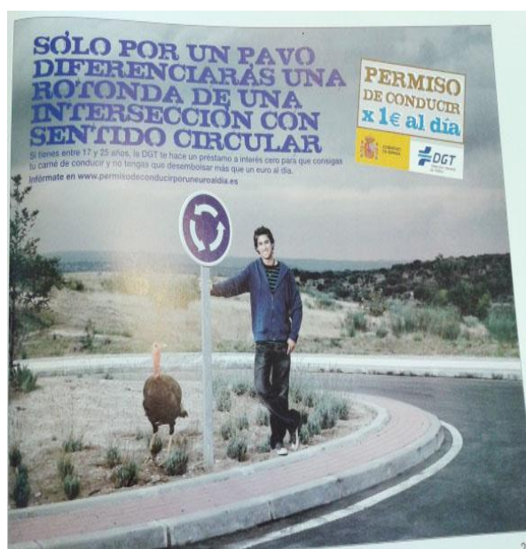
Imagen 3. Solo por un pavo diferenciarás una rotonda de una intersección con sentido circular. Código 0015. Año 1990.