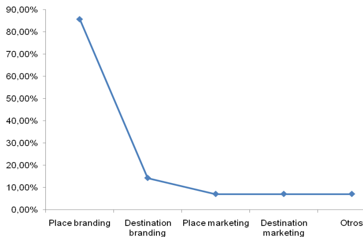
Figura 1. Resultados obtenidos de los expertos en porcentajes.

La segunda pregunta planteada en el contexto del Delphi quería incidir en la confusión conceptual inherente a la marca de territorio en cuanto a la adaptación y traducción de la terminología procedente del ámbito anglosajón. La opción predominante de los expertos se correspondió con el término ‘place branding’. Sin embargo, hubo una experta que se decantó por dos opciones de forma simultánea, concretamente, ‘place marketing’ y ‘place branding’. Otro miembro del panel siguió esta misma fórmula para elegir dos respuestas posibles: ‘place branding’ y ‘destination branding’. Una tercera participante sugirió también una doble respuesta: ‘destination branding’ y ‘destination marketing’.